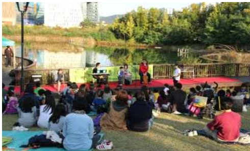
▲ 자원봉사자의 날